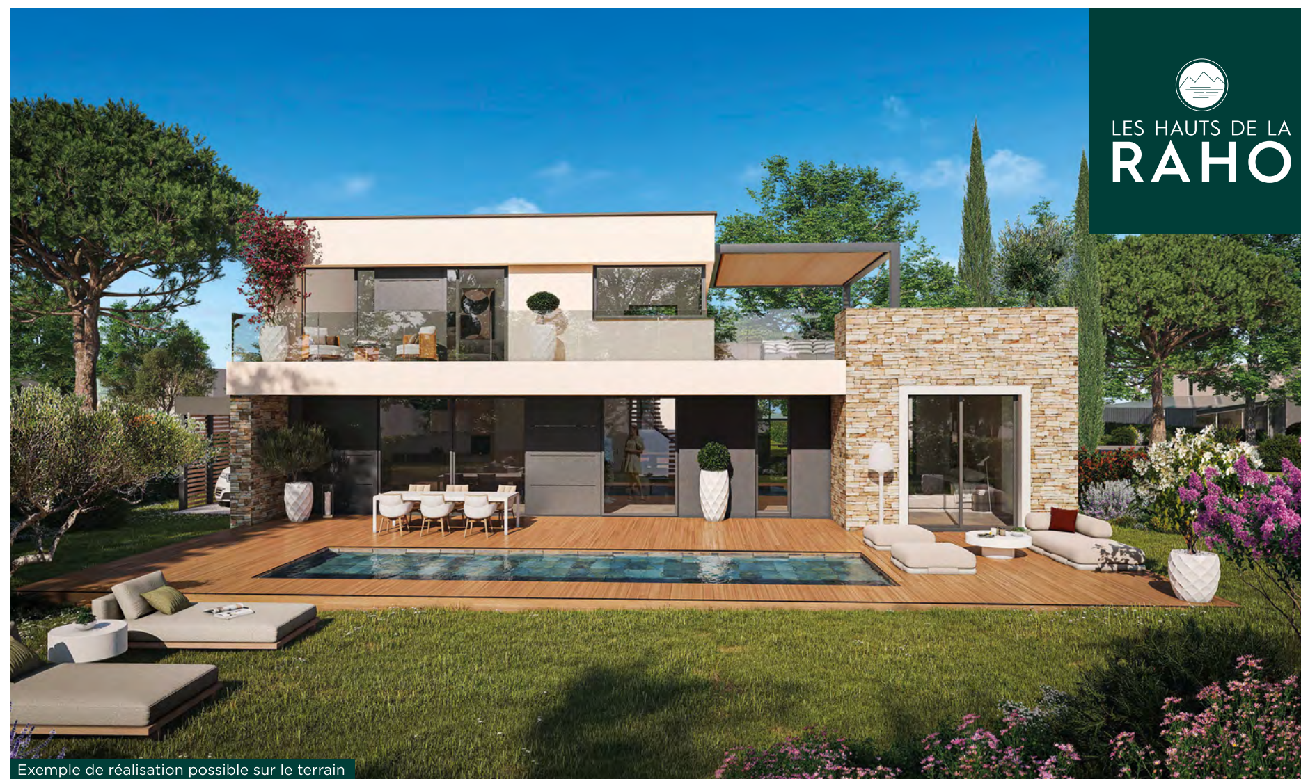
Exemple de réalisation possible sur le terrain